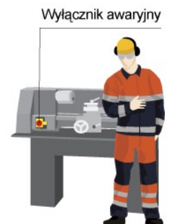
Rys. 1. Wyłącznik awaryjny