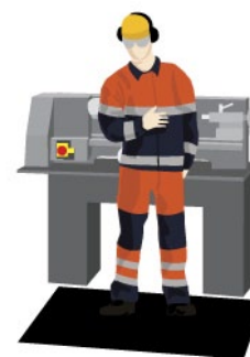
Rys. 3. Mata antyzmęczeniowa