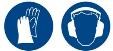
Rys. 4. Przykładowe znaki bezpieczeństwa – znaki nakazu: „Nakaz stosowania środków ochrony”