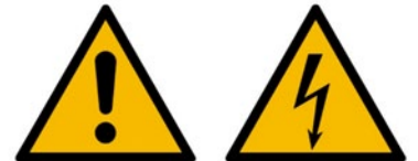
Rys. 3. Przykładowe znaki bezpieczeństwa – znaki ostrzegawcze: „Uwaga!”, „Grozi porażeniem prądem”