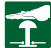
Rys. 5. Przykładowe znaki bezpieczeństwa – znaki informacyjne: „Wyłącznik awaryjny”