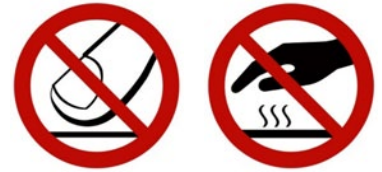
Rys. 2. Przykładowe znaki bezpieczeństwa – znaki zakazu: „Zakaz dotykania”, „Powierzchnia gorąca”