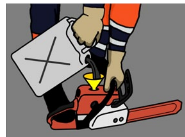
Rys. 2. Prawidłowy sposób uzupełniania paliwa w narzędziach spalinowych