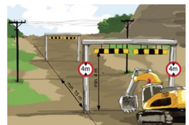
Rys. 2. Bramka ograniczająca wysokość przejazdu