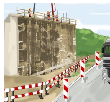
Rys. 4. Wyгородzenie strefy niebezpiecznej